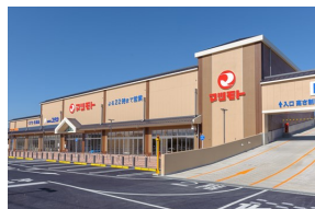
「マツモト桂川店」 京都市南区久世築山町